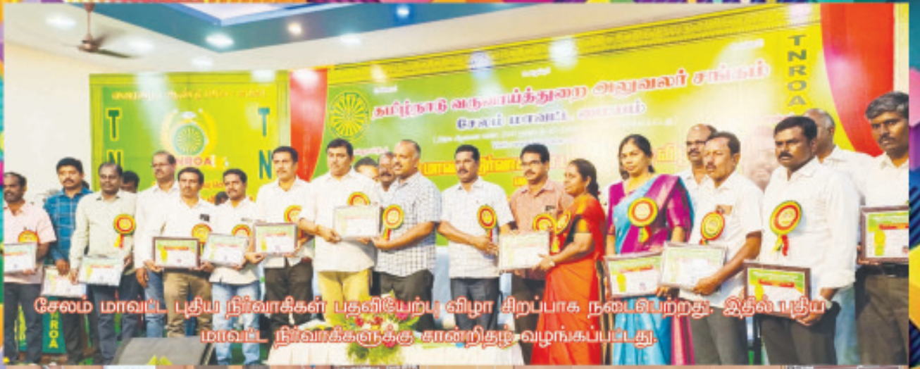
சேலம் மாவட்ட புவிய நிர்வாகிகள் பதவியேற்று விழா சிறப்பாக நடைபெற்றது. இதில் புவிய மாவட்ட நிர்வாகிகளுக்கு சான்றிதழ் வழங்கப்பட்டது.