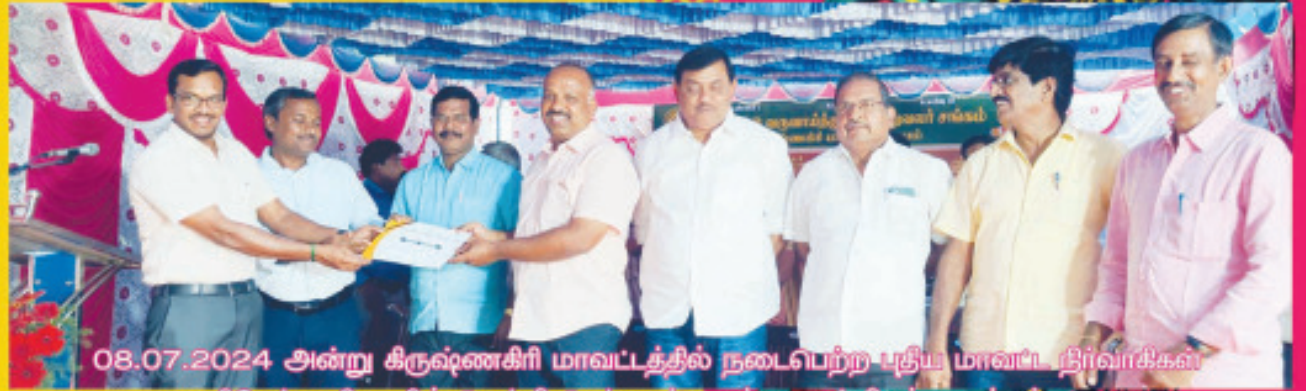
08.07.2024 அன்று கிருஷ்ணகிரி மாவட்டத்தில் நடைபெற்ற புவிய மாவட்ட நிர்வாகிகள் பதவியேற்று விழாவில் வெற்றி பெற்றவர்களுக்கு சான்றிதழ் வழங்கப்பட்டது.